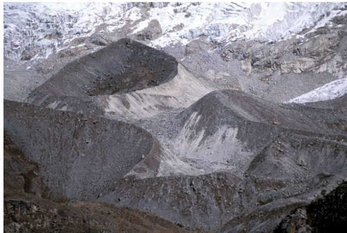
Morrenas de la Pequeña Edad de Hielo, Huascarán, Cordillera Blanca, Perú

De Bolivia a Ecuador, los estudios realizados por el equipo del IRD en las morrenas (5) han permitido demostrar que después de los siglos X-XII de nuestra era, los glaciares emprendieron un movimiento general de avance, que culminó entre 1630 y 1730, considerado como el mayor de la PEH en los Andes centrales. Se ha calculado que la temperatura en los Andes había bajado en este periodo \sim 1^{\circ}\text{C} en comparación con la temperatura promedio del siglo XX y que las precipitaciones habían aumentado en un 30 por ciento en comparación con las actuales. Tanto en los trópicos como en otros lugares, es razonable pensar que la PEH pudo ser provocada por una disminución notable de la actividad solar; en efecto, entre 1650 y 1715, una gran reducción en las manchas solares, denominada Mínimo de Maunder , fue detectada gracias a la observación que se realizó con el telescopio recién perfeccionado por Galileo. Las manchas tienden a desaparecer cuando la actividad del Sol es más baja. Luego, los glaciares en los Andes centrales emprendieron un retroceso paulatino en la segunda mitad del siglo XVIII, solo interrumpido por algunos avances menores durante el siglo XIX. El descenso de las precipitaciones es el que inicia la desglaciación, mientras que la elevación de la temperatura toma el relevo a partir de la segunda mitad del siglo XIX.