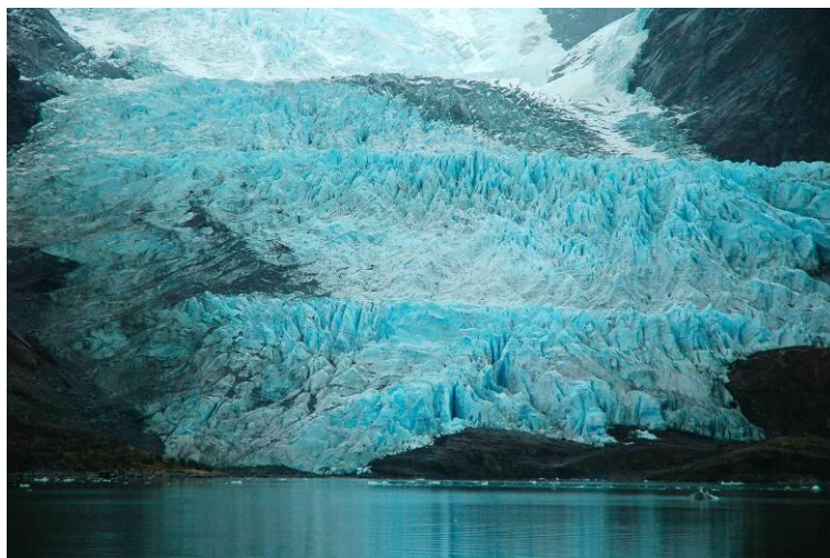
Glaciar llegando al mar en la Tierra de Fuego chilena