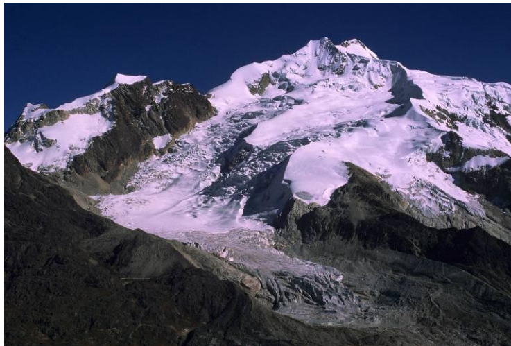
Glaciar de Zongo un año con un línea de nieve baja (5050 m): La Niña de 2000

Existen pocos datos de temperatura y de precipitación en series largas y continuas a más de 4 000 m de altitud sobre las últimas décadas. Por extrapolación de mediciones de estaciones situadas a baja altitud, se estima que la temperatura ha aumentado en 50 años de 0,6 a 0,7°C en los Andes centrales (9). Gracias a perforaciones que hicimos en las masas de hielo frío de gran altura, como en el Illimani en Bolivia a los 6240m, tenemos indicaciones que la temperatura atmosférica ha subido un poco más de 1°C durante el siglo XX (10). Hay mayor incertidumbre en cuanto a la precipitación, ya que es difícil identificar una tendencia clara a nivel del área regional. Existen entonces muchas razones para pensar que la elevación de la temperatura atmosférica es la que ha originado la disminución de los glaciares de los Andes tropicales. Los estudios realizados con ayuda de modelos muestran que los glaciares tropicales son muy sensibles a la temperatura: en el glaciar Zongo en Bolivia, por ejemplo, se estima que por cada grado centígrado de aumento en la temperatura, la línea de equilibrio sube en altitud 150/200 m (11).