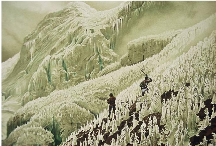
Subida al Chimborazo, expedición de Hans Meyer 1903 – Acuarela de R. Reschreiter

sus glaciares (1). En la década de los 1930 en Perú, gracias a expediciones austríacas, y más tarde en la de los 1970 en Bolivia, Colombia y Ecuador aparecen las primeras cartografías precisas de los glaciares que permitirán estudiar sus fluctuaciones y vigilar las lagunas peligrosas abandonadas por su retroceso; esas lagunas constituyen un verdadero peligro cuando, por lo general con sismos violentos, se vacían intempestivamente y provocan miles de víctimas, en particular en la Cordillera Blanca del Perú (2).