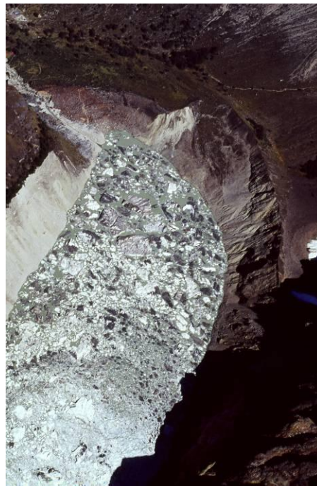
Laguna Arhwaycocha en la Cordillera Blanca, con icebergs, después de una caída de hielo