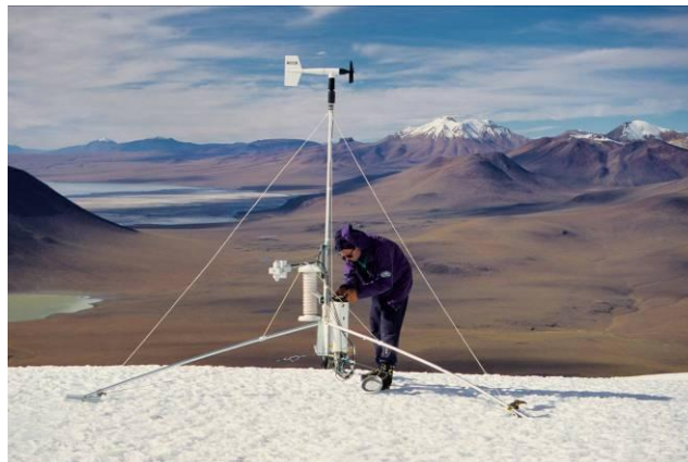
Estación midiendo el balance energético a 5500 m. Sur de Bolivia

Sin embargo, no se puede relacionar la evolución de los glaciares y los cambios ocurridos en el clima sin interrogarse sobre la física de los procesos de ablación, que se conoce a través de los estudios realizados por el equipo de IRD en Bolivia en el glaciar Zongo (16°S) y en Ecuador en los glaciares 15 y 12 del Antisana (0°28S) (8).