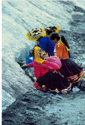
Mujeres colectando el hielo en el frente del glaciar de Qolquepunco durante la fiesta del Qoyllur Rit'i

atmósfera tienden a hacerla disminuir por fusión y por sublimación. La sublimación es el proceso por el cual un sólido pasa al estado de vapor y sólo se activa cuando el clima es frío, seco y ventoso. En el caso del hielo, la sublimación requiere mucha energía, más de ocho veces que la fusión, que lo transforma de estado sólido al líquido.