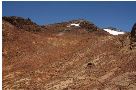
Glaciar de Chacaltaya en 1996 y 2009.